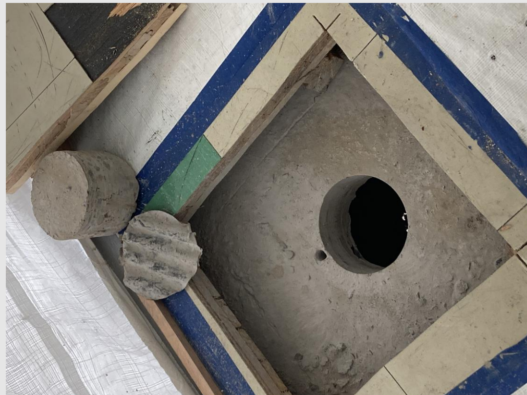
Exemple d'ouverture au plancher