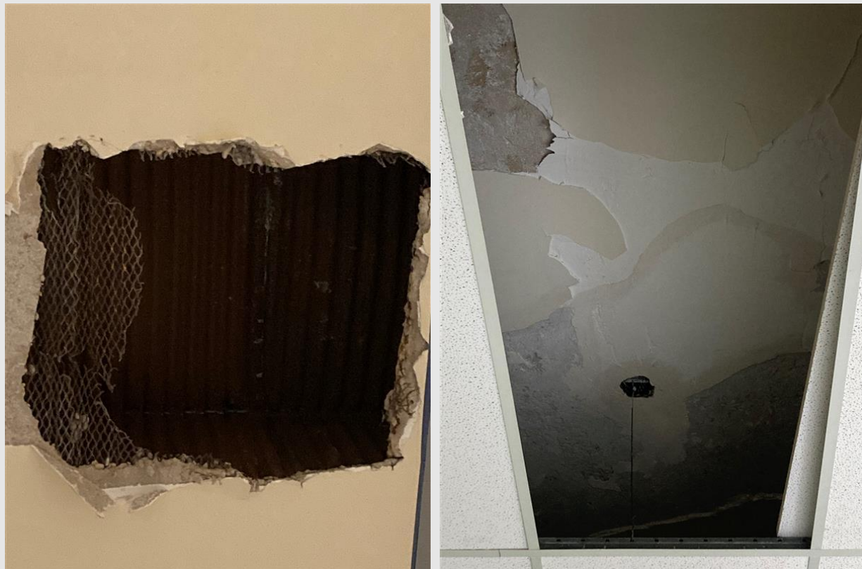
Exemple d'ouverture au plafond